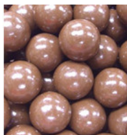
塩チョコレートボール500g