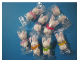
チョコレート うさぎのチョコレート ボール 160g(約48個)