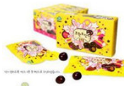
(先払いのみ) 韓国芸能グッズ 無限 挑戦 チョコボール