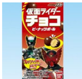
仮面ライダーオーズ000 仮面ライ ダーチョコピーナッツボール2 食玩 バンダイ(大箱1箱に20個入り)