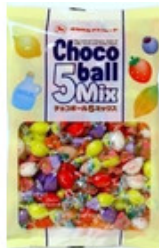
チョコボール5ミックス【タカオカ】