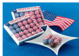
アメリカンフラッグボールチョコレート 12箱セット【アメリカ発】