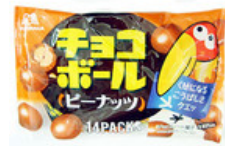
MORINAGA 森永 チョコボール ピーナッツ 14 PACKS