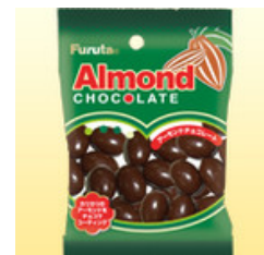
アーモンドボールチョコ 袋タイプ(2袋単 位での販売)【フルタ製菓】