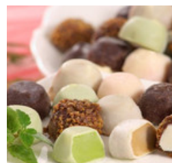
【送料無料】チョコアイスボールセット(6 5粒入)