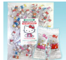
【クール便の場合は同梱不可】歯医者さんが作った『ハローキティのボールチョコ』300g