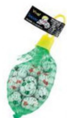
サンチョコ ボール ネット入り 24ネット 28-CN-2サッカーボール