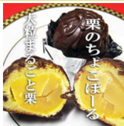
バレンタイン・チョコレート・プチギフト・栗のチョコ饅頭・まるごと栗のチョコボール

「チョコボール」という名の付く、または類似の名前の商品例 (2011年2月18日現在 yahoo!ショッピング、amazon.comより。)