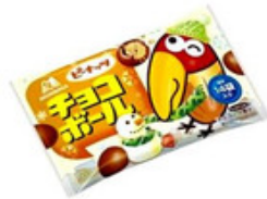
森永 チョコボール (ピーナッツ) 14パック入り