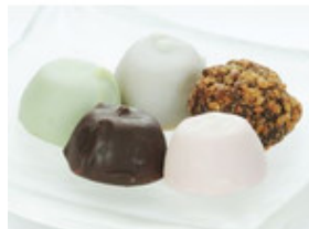
業務用 アイスチョコボール 約1 3g x 30粒入 ヒカリ乳業 冷凍食 品 食材 通販