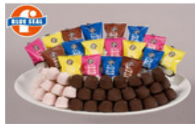
「送料込」パーティーチョコボール 2010ブルーシール